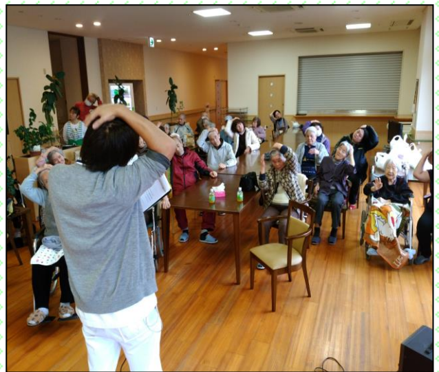
肩こり解消！体操教室