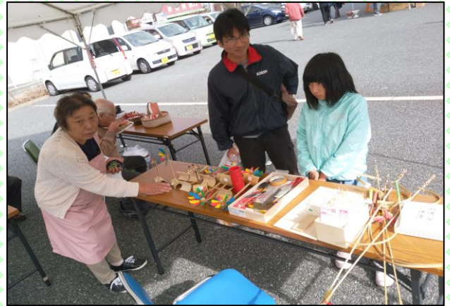
竹とんぼ製作体験

曇空で少し肌寒い天気でしたが、たくさんの方にご来場いただき、よかもん商店の出店や演芸(沖縄エイサー、和太鼓、ちんどん屋)で賑わいました。